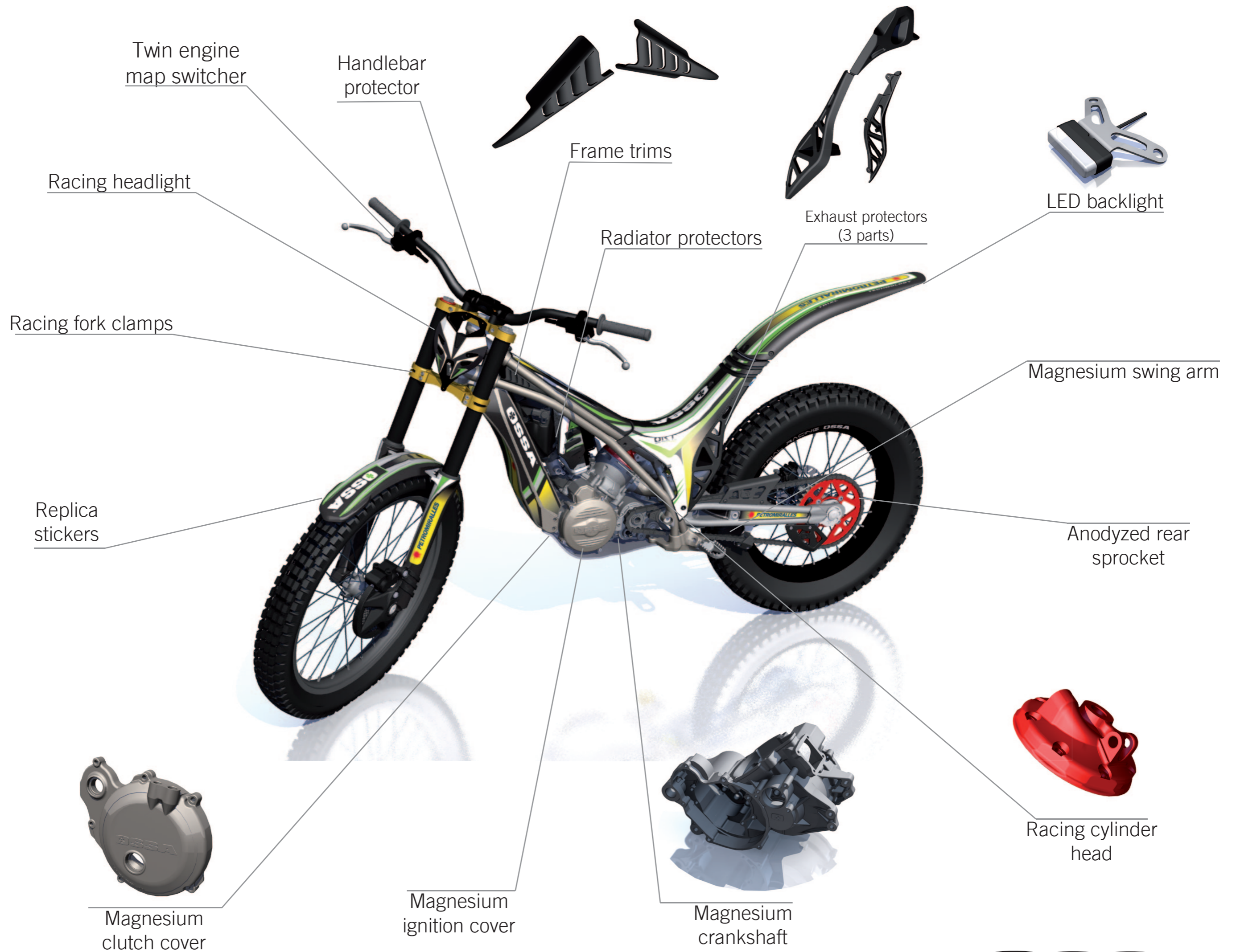
Twin engine map switcher