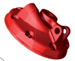
Racing cylinder head