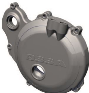
Magnesium clutch cover